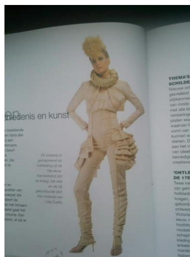
Ontwerp van Lola Cuello, Naar hofkleding uit de 18 e eeuw

-De ontwerpen zijn karaktervol en op modefiguur getekend. Kies bewust materiaal en techniek voor sfeer en textuur. Probeer eventuele technieken uit en bevestig dit bij je ontwerp (eventueel foto)